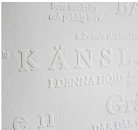
Det står ett Landskap där borta.

Varje projekt introduceras genom att visa bilder från olika konstnärers arbeten kopplat till projektet med syfte att inspirera och skapa nyfikenhet och en större förståelse för konstnärens roll, för konstens och estetikens betydelse i samhället.