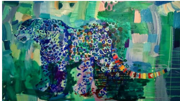
Camilla Rosberg "Hell of a landscape" detalj, och "Blå jaguar med regnbågssvans"