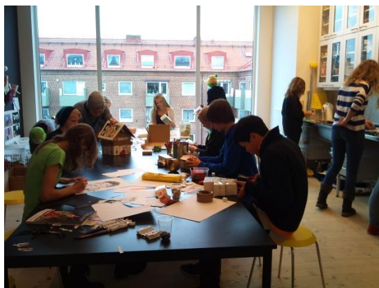
Varbergs konsthall på Kulturhuset Komedianten